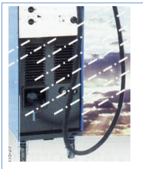
Figura 02 Incidência de jatos de água sobre uma máquina de solda

Os invólucros dos equipamentos elétricos devem oferecer um determinado grau de proteção aos seus componentes. Esta proteção varia conforme as características do local em que serão instalados e de sua acessibilidade. A Figura 02 apresenta a incidência de jatos de água sobre uma máquina de solda. A capacidade do gabinete da máquina de suportar os jatos de água, para valores de pressão e ângulo de incidência, sem que haja penetração de água, define seu grau de proteção.