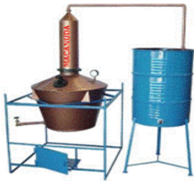
Alambique Com Resfriador