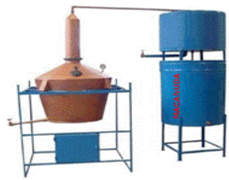
Alambique C/ Pré-Aquecedor e Resfriador