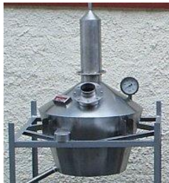
Alambique em Aço Inox