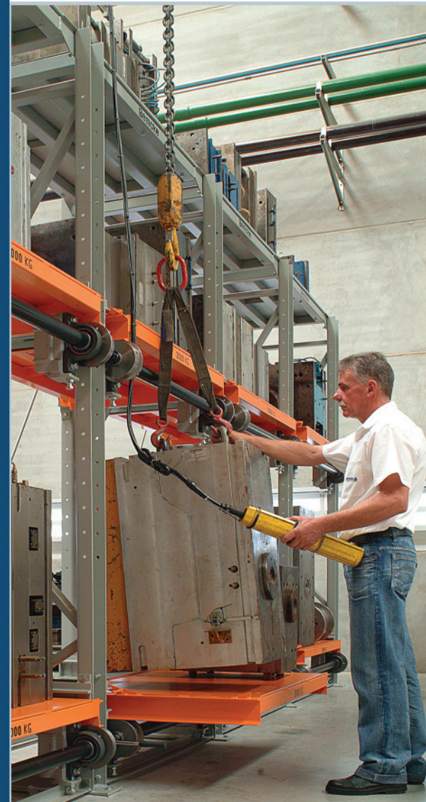
Ferramentas de Injeção de Plástico