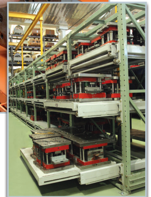
Ferramentas de Estamparia